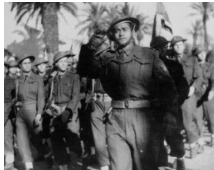
Photographie probablement prise en Indochine, sans date. Des unités du FTEO portaient encore la « salade britannique » au début du conflit : jusque 1950, les tenues restent très hétéroclites.

En glorifiant sa bravoure, la presse met en évidence une culture d'armes qui s'appuie sur un vocabulaire spécifique exprimant la vitalité du corps et la cohésion des forces militaires : « Ce chef à la résistance physique exceptionnelle, pourchassant sans trêve les bandes rebelles, est toujours aux points les plus menacés de son secteur. Surprenant les Vietminh dans leurs repaires,