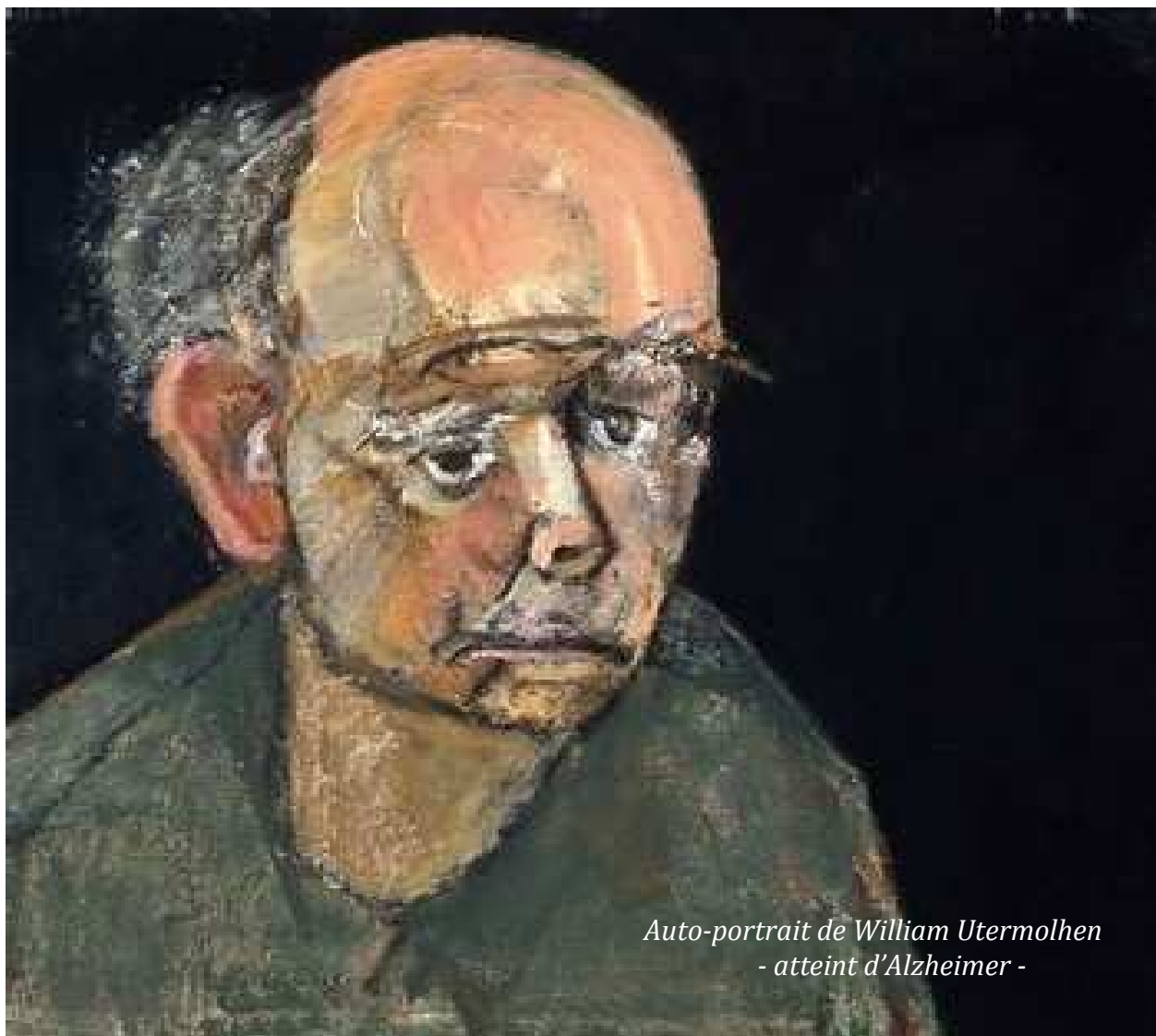
Auto-portrait de William Utermolhen - atteint d'Alzheimer -

On entend souvent que la personne qui souffre de la maladie d'Alzheimer retombe en enfance. C'est effectivement un retour à l'immaturité neurologique des premières années de vie. Cependant, alors qu'un jeune enfant découvre la vie pour progressivement gagner en autonomie, une personne atteinte de la maladie d'Alzheimer va petit à petit la perdre. Ne pas comprendre que l'on risque de s'égarer en sortant seul tout en ayant encore la notion d'être adulte est un paradoxe qui rend l'accompagnement difficile et subtil.