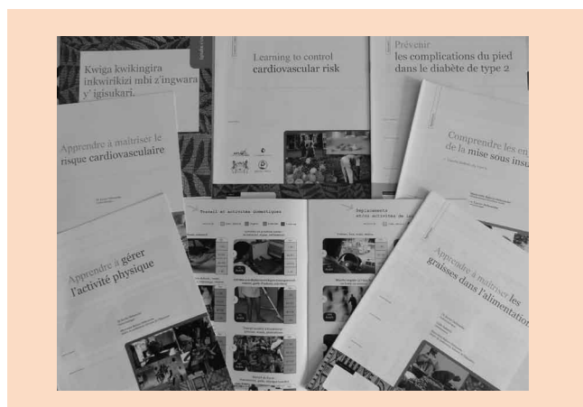
Illustration 1 : Les livrets de la collection Education et Prévention des Maladies Chroniques

les grignotages). Après avoir identifié les bénéfices de chaque action, l'apprenant en choisit une ou plusieurs, en réfléchissant à la pertinence, à la faisabilité et à l'attractivité de chacune d'elles. Invitée à tenir compte de ses dispositions personnelles spécifiques et du contexte social et économique qui est le sien, la personne malade chronique peut alors s'engager à mener ou non l'action qu'elle a choisie.